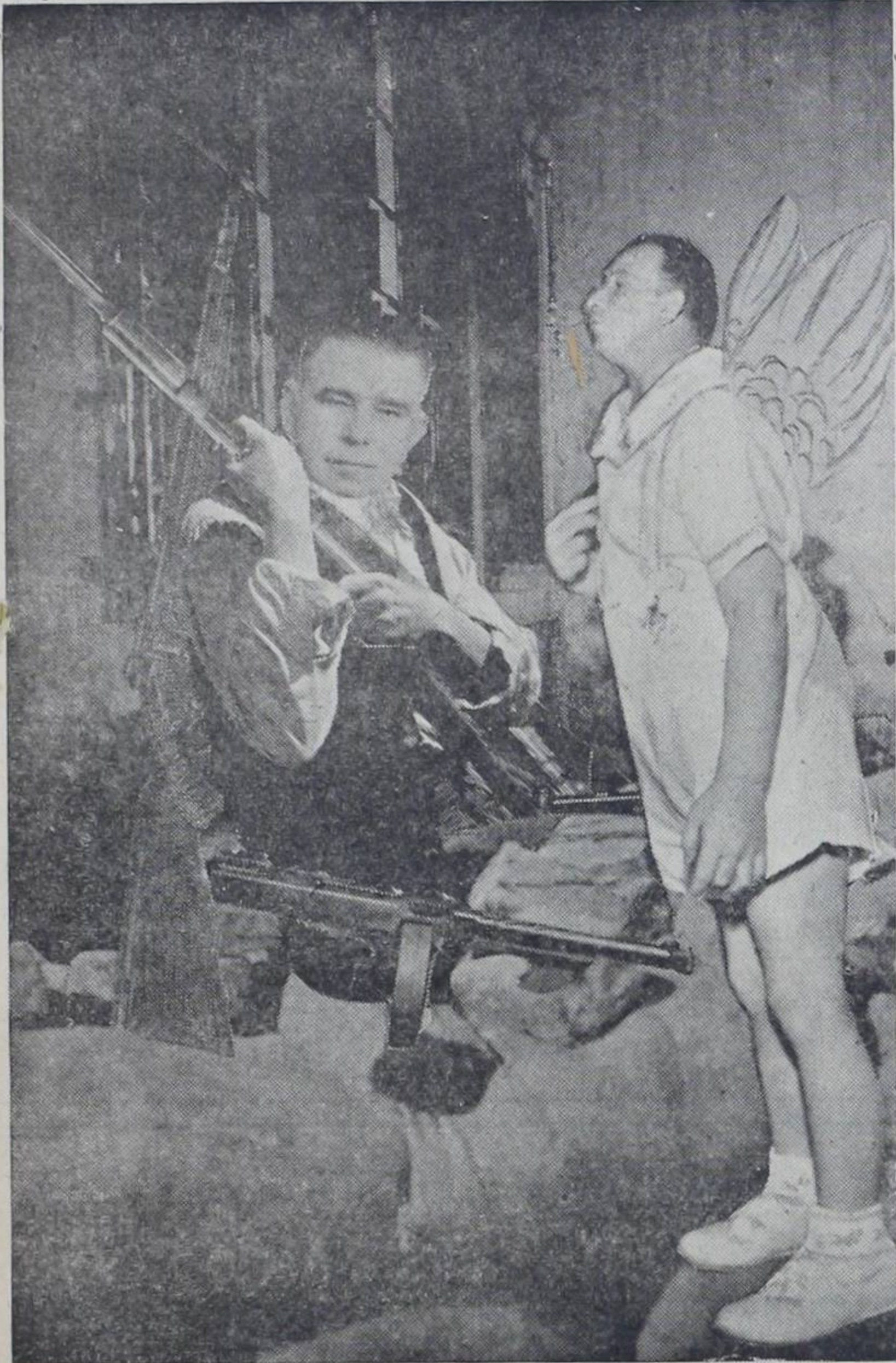
Así lo ha manifestado en diferentes oportunidades. Orlich será el contrario. Este último también se alista desde ya! Así es que no será muy fácil la cosa...!!!