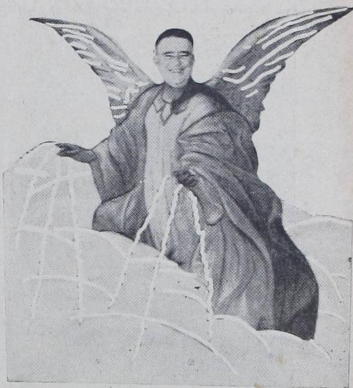
Así, como un angelito, parte hacia la llanura...!!! Buen viaje...!!!