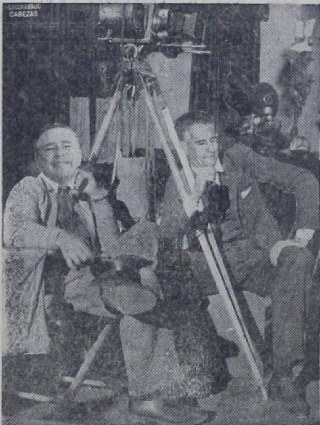
Recuerdan las fiestas de Atenas cuando se pasó para allá la capital con motivo del día de la independencia...? Aquello fué formidable...!!!