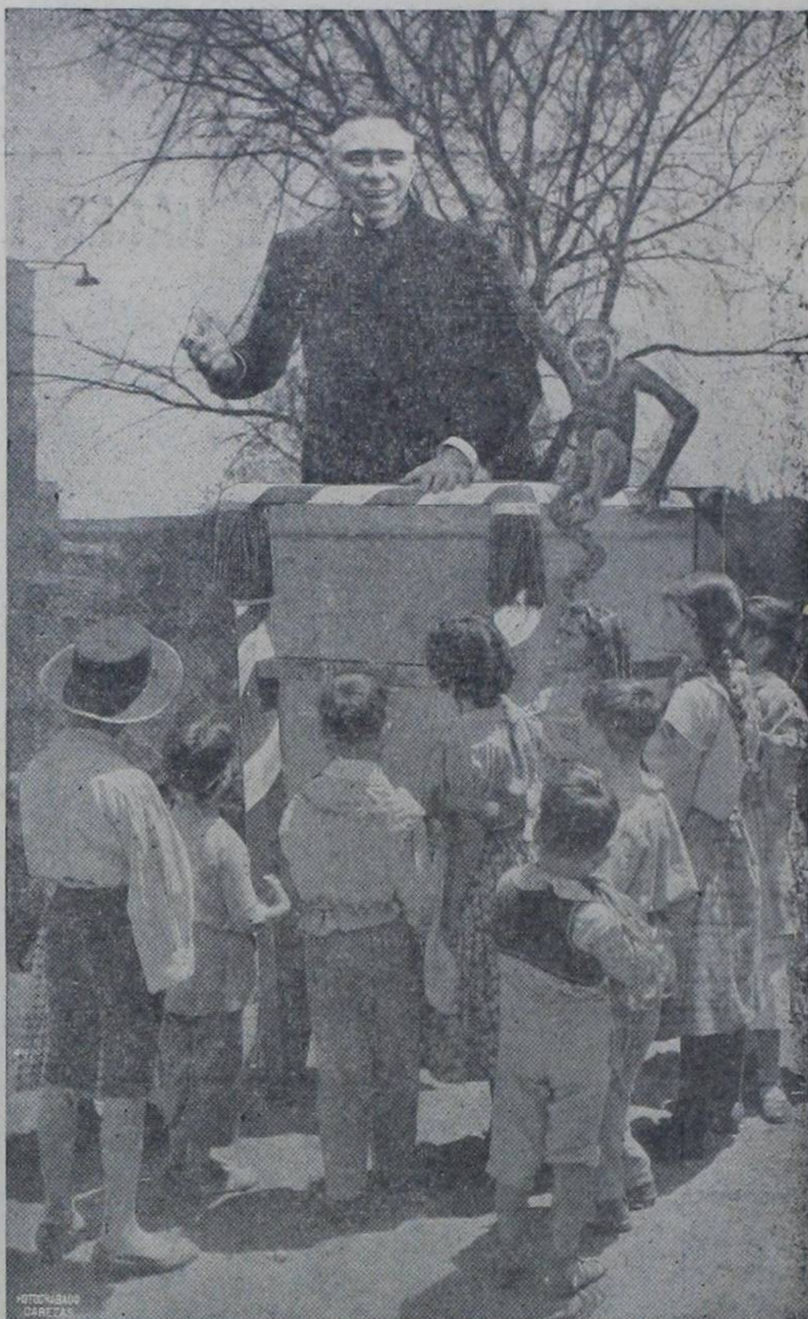
Habló tanto, que casi se queda afónico!!! Pero hay fuerzas para dentro de una temporada...!!!