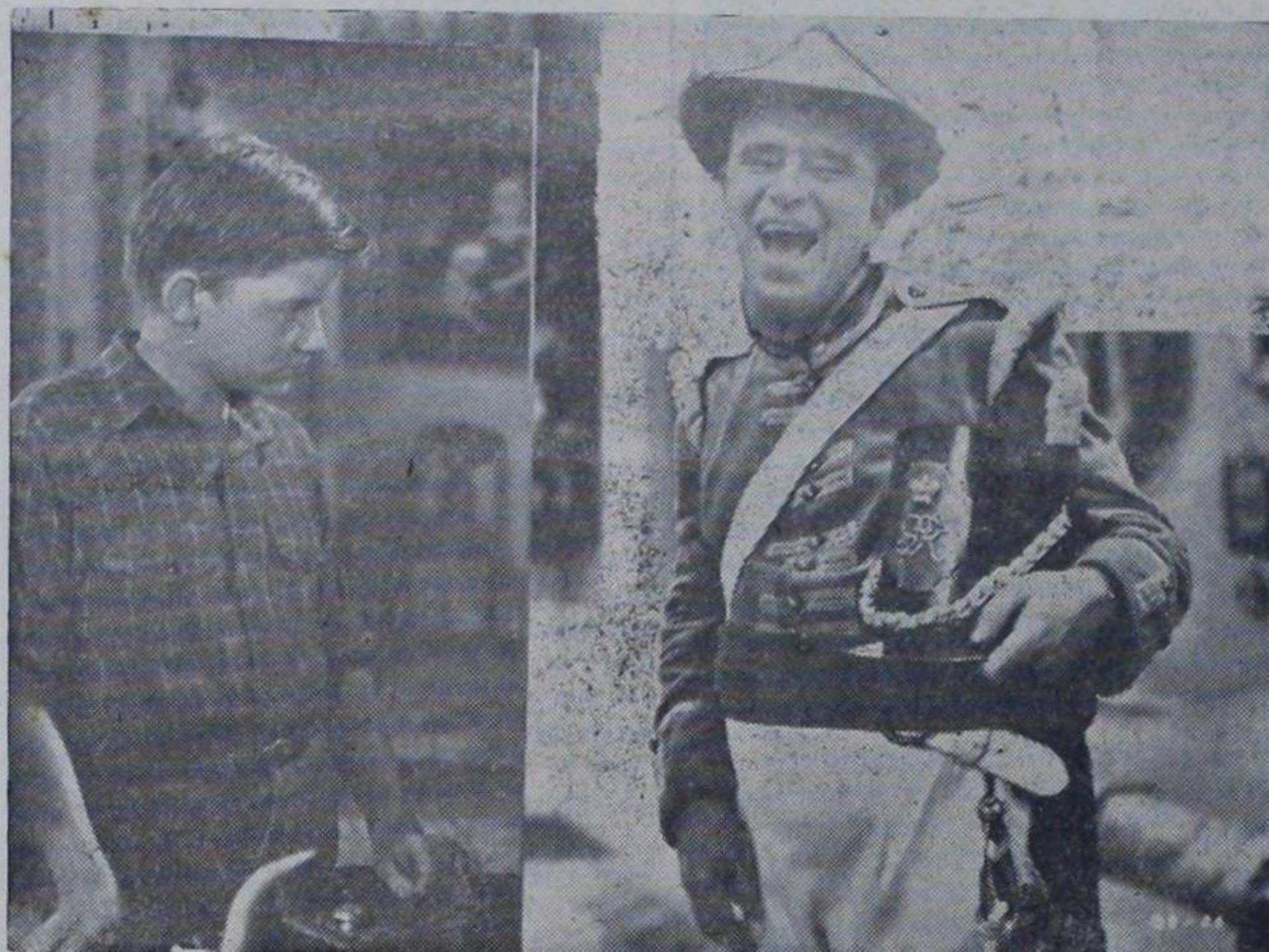
El muerto de risa y el niño compungido (?). El presidente con un redactor de "La República". Muchas veces más se encontrarán al decir de los habladores...!!! Qué horror...!!!