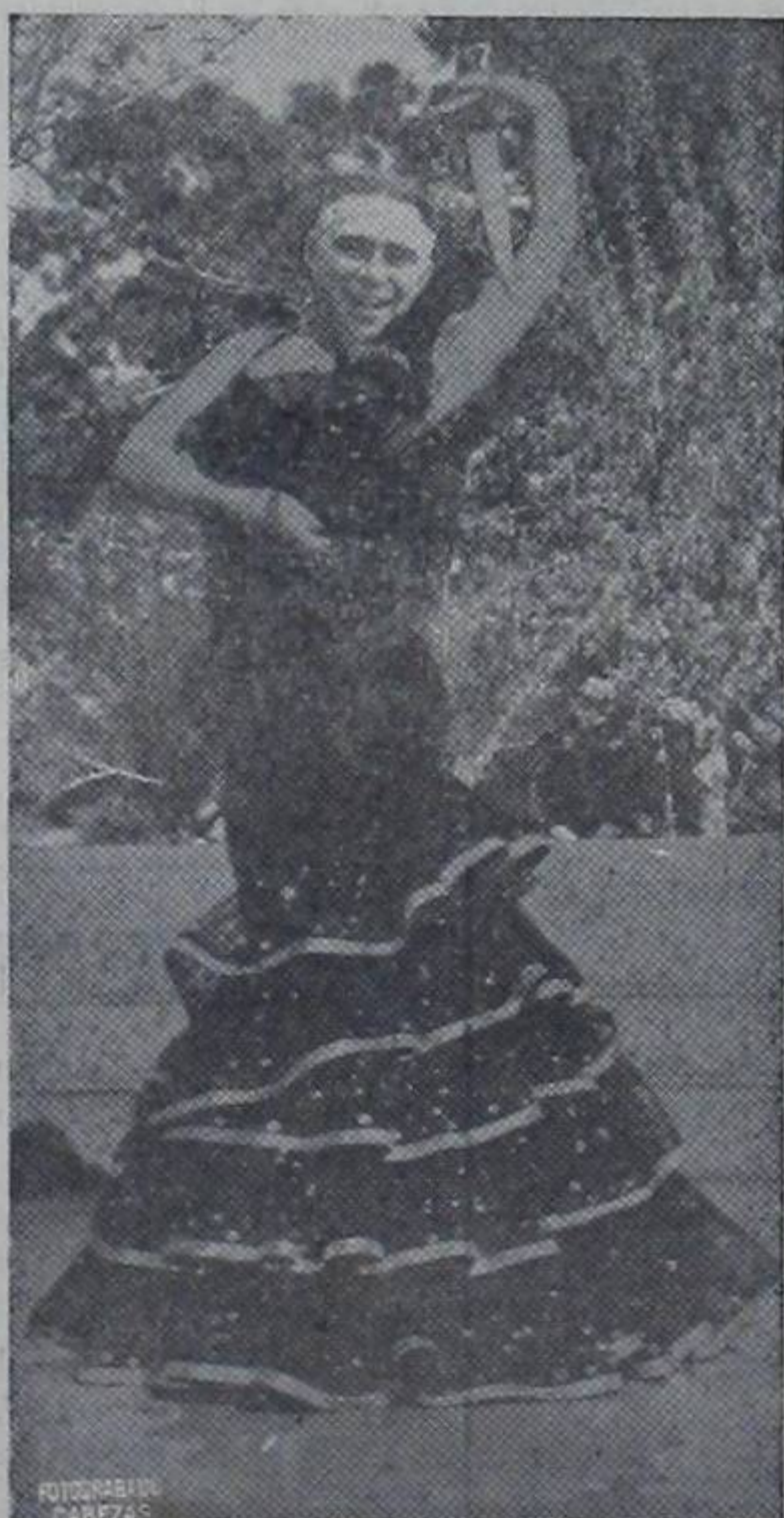
En una de tantas fiestas de inauguración...!!!