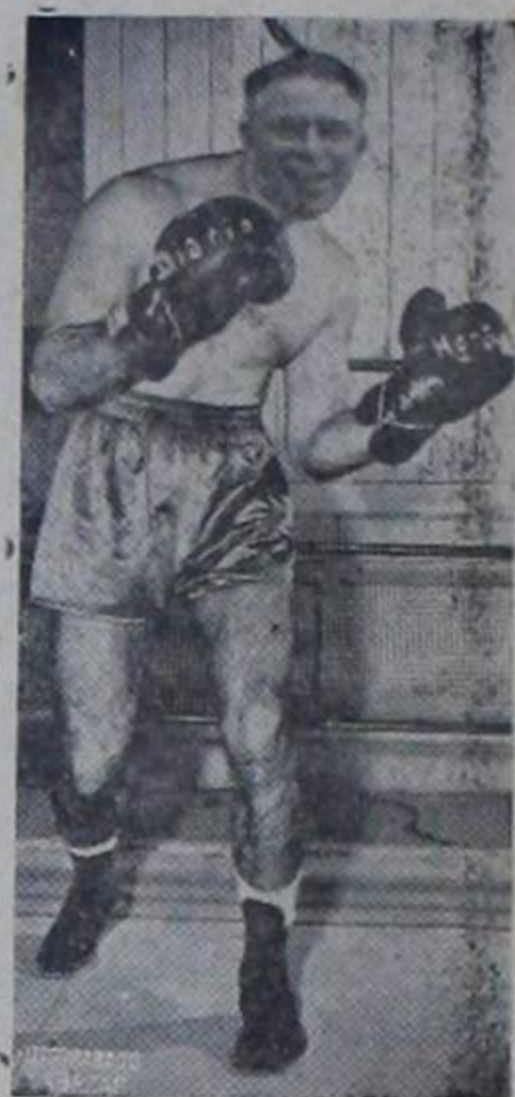
Con La Hora y el Diario de Costa Rica, dicen que ha de fregar más que una avispa con un año de no picar! Huyuyuy...!!!