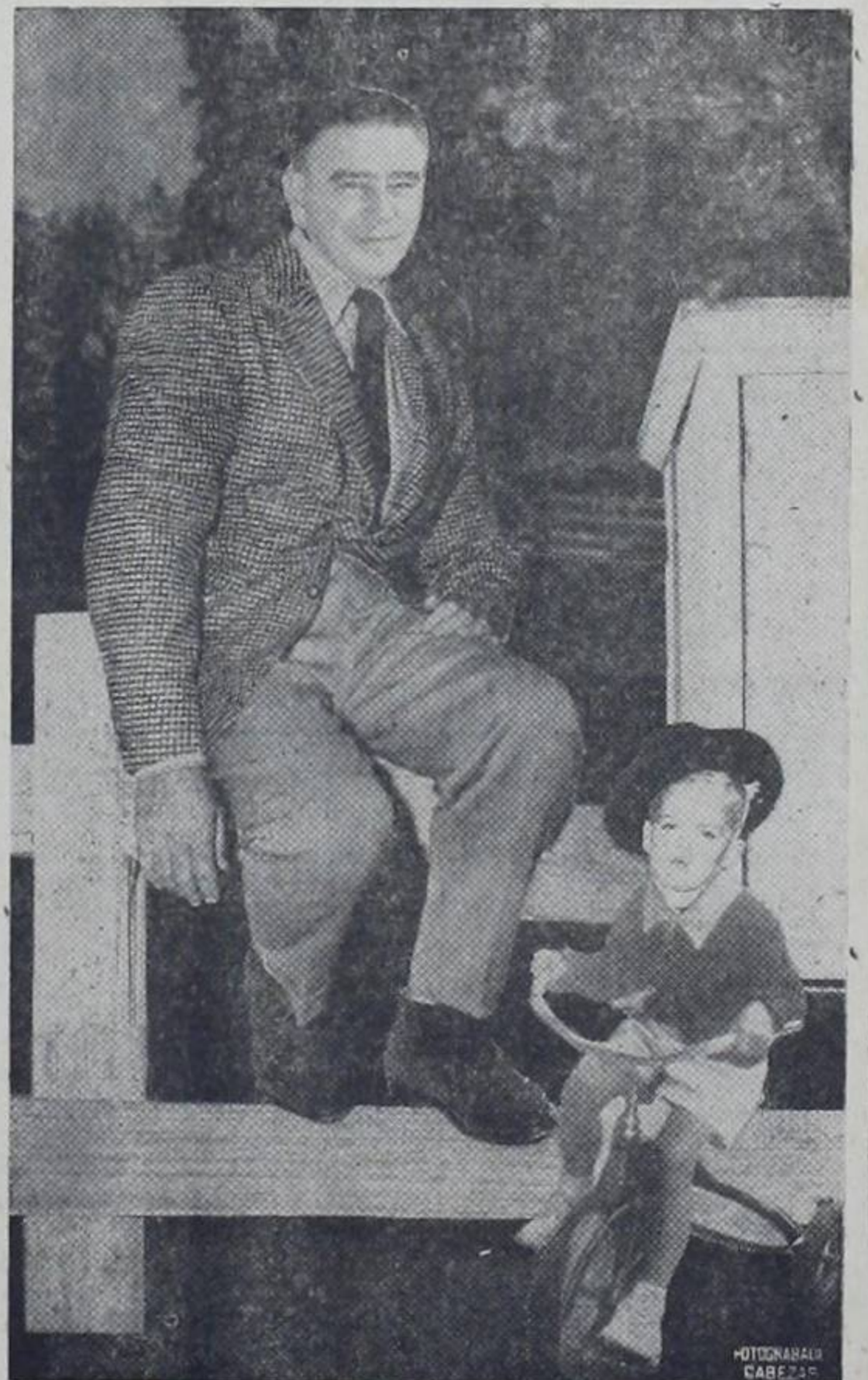
Eso le valió muchas simpatías...!!! Veremos cómo le va dentro de cuatro años y medio...!!!